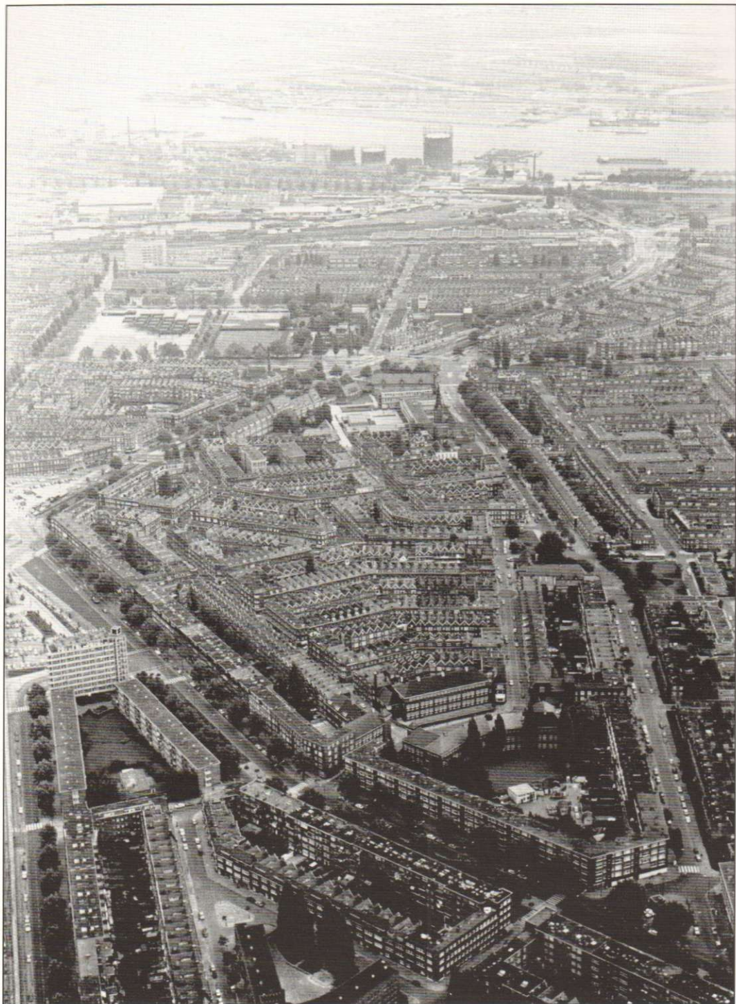
4. Omstreeks 1970 is deze foto gemaakt. In het midden onderin de Millinxbuurt. De linker-poot van het v-vormige gebouw is de school in de Moerkerkestraat. Op de achtergrond de Nieuwe Maas met drie opslagtanks van de Gasfabriek Feijenoord. Rechts daarvan bevindt zich het Mallegat met het gelijknamige drijvende zwembad.